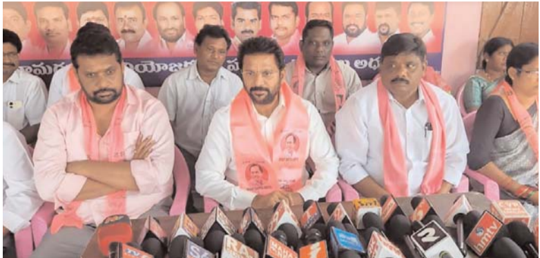
నెలకొన్న త్రాగునీరు సమస్యలు పరిష్కారం చేయాలన్నారు. స్థానికంగా ఉన్న ప్రజాప్రతినిధులు ఇక్కడి ప్రజల జీవితాల్లో వారి జీవన విధానంలో వెలుగు నింపే కార్యక్రమాలను తీసుకొని ముందుకు పోతే భాగంతుందని చెప్పారు. ఎన్నికల సమయంలో మేం గెలిస్తే మార్పు తీసుకొస్తామని చెప్పి అధికారంలోకి వచ్చాకా చిరు వ్యాపారుల దుకాణాలు కుల్చడం వారిని రోడ్డున పడేయాడమేనా మీరు తెచ్చిన

ఎలాంటి సమయం ఇవ్వకుండా దౌర్జన్యంగా వారి దుకాణాలను కట్టడంతో వ్యాపారులను అవేదన చెందుతున్నారని భయ భ్రాంతులకు గురైతున్నారని అన్నారు చిరు వ్యాపారులకు ప్రత్యామ్నాయ మార్గం చూపకుండా వారి దుకాణం కూల్చివేయడం ఎంటని ప్రశ్నించారు. వ్యాపారులు చేసుకుంటేనే బతికే పేద కుటుంబాలను రోడ్డుమీద పడేయడం సింగరేణి సంస్థకు ఎంతవరకు న్యాయమన్నారు. చిరు వ్యాపారులకు న్యాయం జరగకపోతే బిఆర్ఎస్ పార్టీ పక్షాన పోరాడుతామని జిఎం కార్యాలయం ముట్టడి చేపడతామని రాష్ట్రవ్యాప్తంగా ఈ సమస్యను తీసుకెళ్తామని ఆయన హెచ్చరించారు. పద్దేళ్ల కెసిఆర్ నాయకత్వంలో 100 కోట్ల నిధులతో రామగుండం కార్పొరేషన్ లో త్రాగు నీరు డ్రైనేజీ సమస్యలను తీర్చడం జరిగిందన్నారు. టీ యు ఎఫ్ ఐ డి సి నిధులతో రామగుండం కార్పొరేషన్ లో మౌలిక సదుపాయాల కల్పన కోసం తమ వంతు ల కృషి చేశామని చెప్పారు. పారిశ్రామిక ప్రాంతంలో కాలనీల్లో